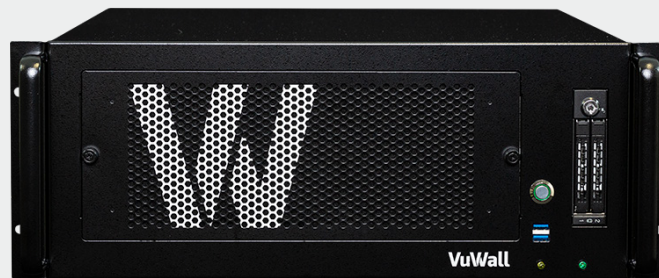
VuScape VS120, VS280, VS640