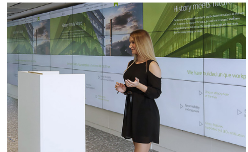
PRÉSENTATION ET COLLABORATION