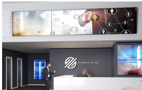
GESTION ET DISTRIBUTION DE CONTENU