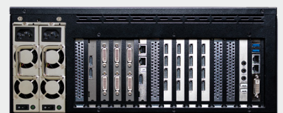
VuScape VS640-3, face arrière