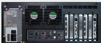
VuScape VS120-2, face arrière