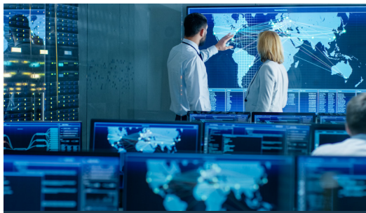
GESTION DE MUR VIDÉO & KVM