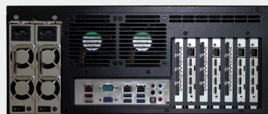
VuScape VS280-2, face arrière