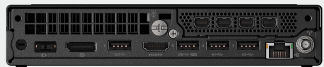
VuScape VS10-4, face arrière

* Les images présentées ne sont pas proportionnelles. Veuillez consulter les spécifications techniques pour les dimensions.